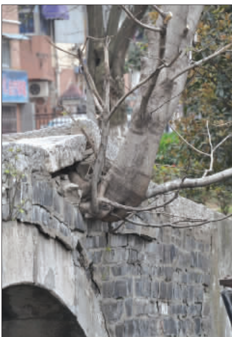
“乔”木 虽然我不够高大挺拔,但还是请称呼我“乔”木。 (请作者速与本报联系)