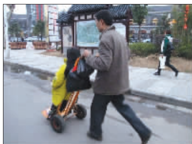
虽然是站票,好歹也算专车接送了。 (作者将获30元话费)

——网友“小逗号”表示,以后去KFC必做这几件事。 点评:估计没买到半价桶的童鞋们都同意!