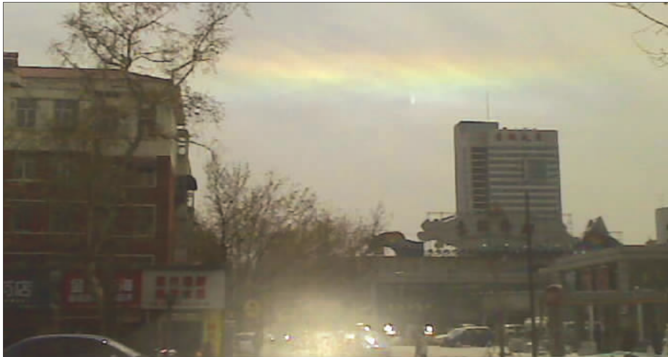
大晴天,出彩虹,真是怪事!老婆,和牛魔王出来看彩虹!