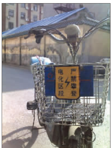
严禁攀登是假,吓唬小偷是真。 (作者将获30元话费)