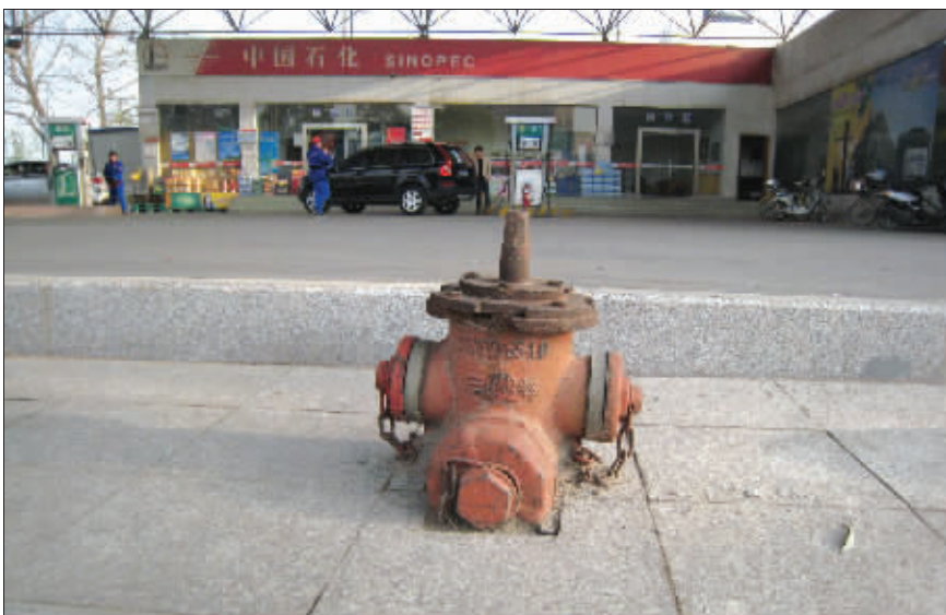
潜伏 洞么,洞么,我已到达指定潜伏位置。把我埋得这么深,万一加油站有火情,我抽不开身咋办? 摄于江宁上元大街167号加油站 (作者陆雪生将获30元话费)