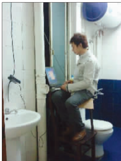
时间紧,任务重,只能在最方便的地方加班了。 (作者将获30元话费)