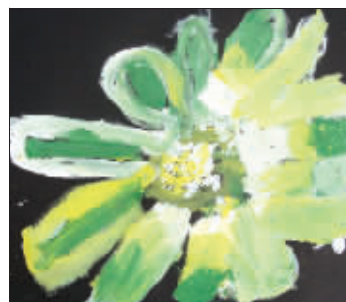
水粉画《美丽的花》褚思曠 鼓楼幼儿园大班

作品上传路径:http://www.xici.net/b1207585/d114055460.htm, 或加qq群79946402发给点点叔叔。