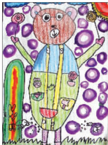
《近视的小熊》981号 诸子涵 5岁 高淳淳西中心幼儿园大班