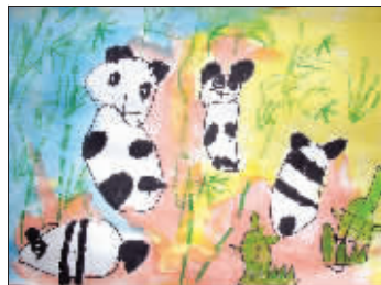
《熊猫一家》980号 芮铭远 3岁 江苏妇女儿童活动中心艺术幼儿园小班