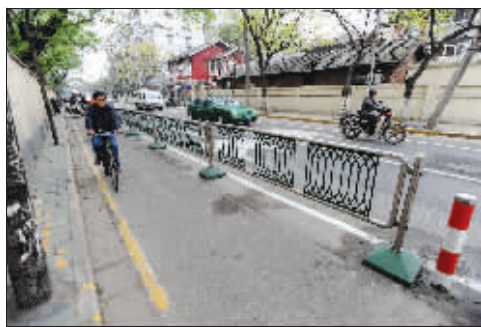
改进后的交通护栏