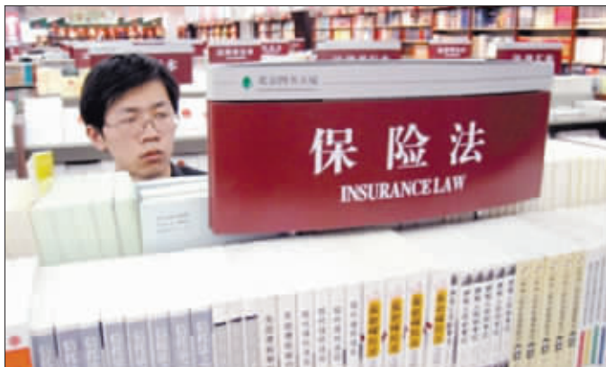
新保险时代的来临,意味着保险市场将进入新的成长阶段

业内人士表示,新《保险法》时代的来临,意味着保险市场将进入一个新的成长阶段。投保人权益得到强化;从承保到优保,保险公司的产品和服务机制也迎来明显改观。