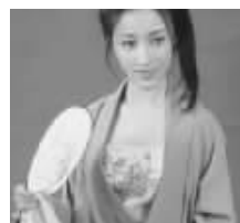
潘金莲日记 微博地址:weibo.com/panjiniandiji

微博《嬉游记》貌似是新浪微博出历史微博日记的鼻祖,自《嬉游记》走红以后,微博上先后出现《大话水浒》、《刘备日记》、《雷锋日记》等微博日记,借死人之名,编写爆笑段子,备受网友追捧。