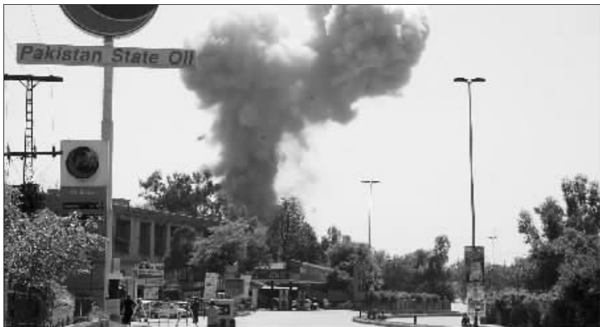
白沙瓦爆炸现场浓烟滚滚