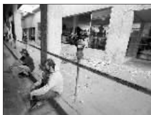
两名男子坐在被地震损毁的商铺外

墨西哥下加利福尼亚州官员说,墨西哥卡利市郊外一座房屋倒塌,压死一名男子。另一名男子地震时夺门而出,不料撞上一辆汽车身亡。市内至少100人受伤,其中多数由高空落下物体所致,通信和供电近乎全部中断。 位于墨美边界另一侧美国境内的卡莱克西科市传出消息,地震致使不少建筑物破损,没有人员伤亡。 综合新华社消息