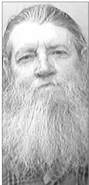
美国邪教头目詹姆斯·沃克

据美国和英国媒体28日报道,美国科罗拉多州科林斯堡市67岁前汽车厂工人詹姆斯·沃克在上世纪90年代自创了一个邪教,该邪教只向女会员开放,沃克对女信徒们谎称,她们只有和他发生性关系,将来才能上天堂。在过去近20年时间里,沃克至少和1000名女信徒发生过性关系,这些女信徒许多都自愿沦为他的“性奴”。可沃克做梦也没想到的是,因为他拒绝了一名女信徒的求爱,这名女信徒竟一怒离开他的农场,前往警察局报了警。这名荒淫的邪教头目随后被美国警方逮捕。美国丹佛市州立法庭日前对此案进行了审理。