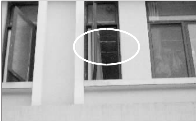
▶女生就是在晾衣架上自缢的

昨天下午,一名大三女生在南京林业大学的宿舍楼内自杀身亡。据了解,这名女生在班级里学习成绩相当好,成绩排名第一。据知情者称,当时其舍友都外出,她在宿舍内洗漱间的晾衣架上自缢,并且留下了遗书。