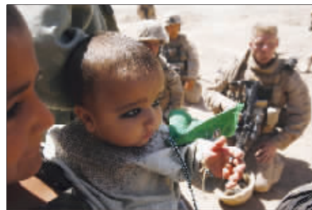
阿富汗儿童注视着美军