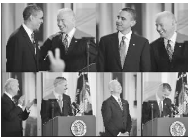
奥巴马和拜登出席签字仪式(拼版照片)

就在奥巴马签署这份历史性的医改法案几分钟后,美国13个州的检察长联手对美国卫生部、财政部和劳工部提出起诉,称医改方案是严重侵犯各州权利的“违宪”法案。据悉,未来还会有更多州加入。这13个州检察长中有12个是共和党籍。