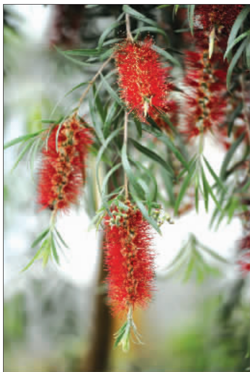
红千层上挂满了红色的“毛刷子”