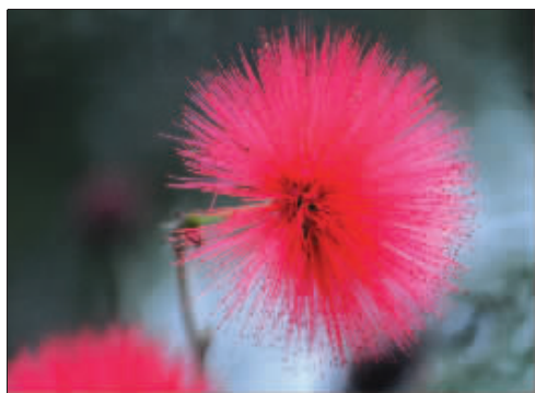
朱缨花浑身是“触须”