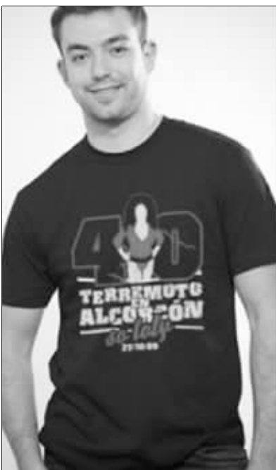
0:4输给阿尔科孔,皇马脸丢大了

本赛季西甲联赛前,皇马主席弗洛伦蒂诺在转会市场上投入了近3亿欧元。但新皇马的表现,却与投入并不成正比。在欧冠赛场上,皇马被里昂挡在了八强之外。在国王杯中,皇马被降级队阿尔科孔羞辱。而在联赛中,皇马虽然与巴萨并驾齐驱,但最近每场比赛中都会出现裁判风波。