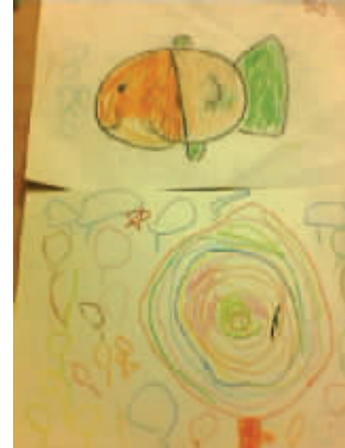
《鱼和棒棒糖》 点点周刊会员宝宝宝华