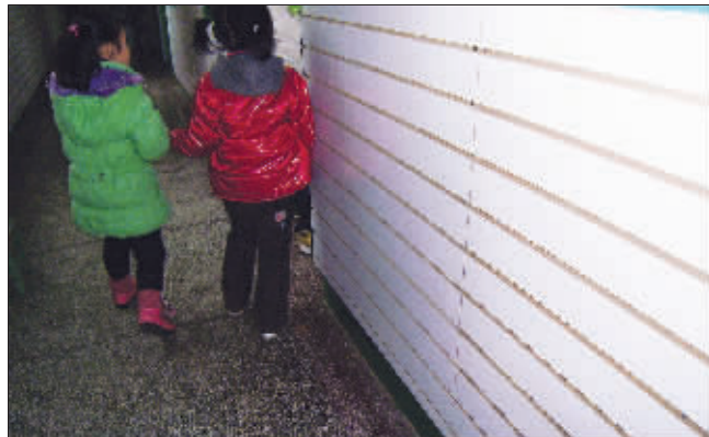
▲楼道新刷了绿漆 ▲走廊内装修一新