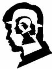
本届香港国际电影节海报

本届电影节从21日起至4月6日截止,长达17天的电影节将展映多部柏林、戛纳等三大电影节的获奖作品。其中包括王全安的柏林获奖影片《团圆》、波兰斯基的银熊作品《捉刀手》、摘得威尼斯金狮的《黎巴嫩》等等。此外,本届电影节还将举办安哲罗普洛斯大师的完整的回顾展,由1972年的第二部戏《三六年的岁月》至2008年的最新作品《时光微尘》,共12部作品都有包揽。安哲罗普洛斯极有可能来香港,在4月5日及4月6日现身其电影《悲伤的草原》和《时光微尘》的首映礼。