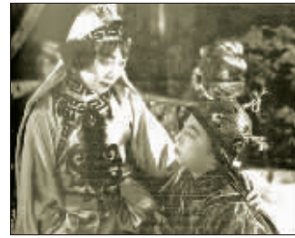
电影《火烧红莲寺》也曾遭禁

当然，《假无常骇人》与《风流和尚》也绝非电影检查会禁映的“孤品”。仅1931年一年，经过电影检查会之手就禁映《火烧红莲寺》《车迟国》《飞侠吕四娘》《劫