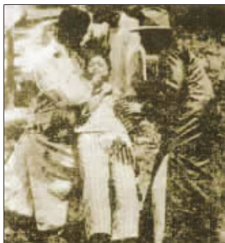
电影《枪毙阎瑞生》有不少惊悚场面

1920年，上海发生了一桩轰动性的社会新闻：洋行职员阎瑞生因赌马而负债累累，遂起歹心，勒死了老相好上海四马路的名妓，曾获得“花国总理”头衔的王莲英，然后抛尸荒野逃遁外地，最后在徐州火车站被上海租界巡捕拿归案。这件案件于1921年7月1日被搬上银幕，由于其时效性和真实性特强，大获成功。连映连满，一星期即收回拍摄成本。