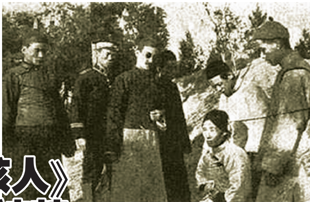
影片《张欣生》剧照，该剧因场面血腥招致禁映