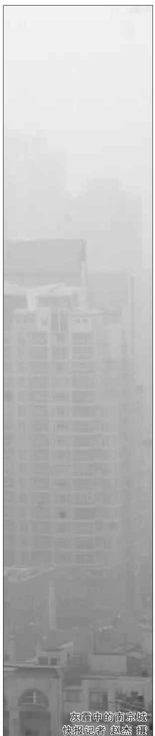
灰霾中的南京城