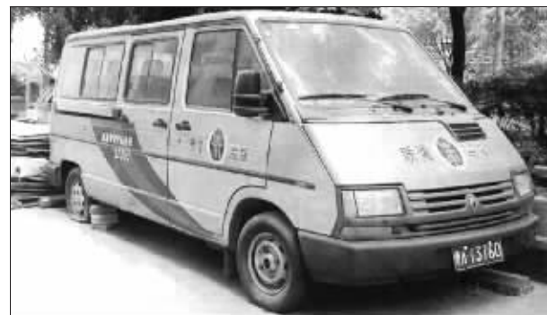
这辆有质量监督标志的车,被弃置在路边

在广州大桥南桥脚附近,有一辆灰色的车牌为粤A13760的雷诺牌面包车,被弃置在路边两年多无人理。这是一辆带有明显标志的质监部门执法用车,最终确认该车属广州质监越秀分局所有。当媒体采访相关质监办公室主任时,该主任竟向记者采访是否“想给政府找事”。