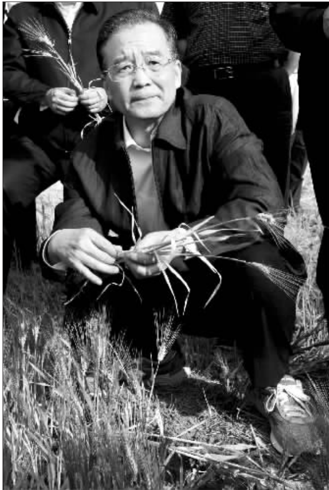
温家宝在大表示范田察看农作物受灾情况

19日和20日晚上,温家宝分别主持召开基层抗旱救灾工作情况汇报会和座谈会。他指出,受灾地区的各级党委政府积极组织干部群众抗旱救灾,付出了巨大努力,取得了初步成效。要毫不松懈地继续抓好抗旱救灾工作,全面落实各项措施:一是优先解决群众饮水问题,绝不能让一名群众没水喝。二是扎实抓好春耕备耕。三是严密防范森林火灾。四是保持灾区市场和社会稳定。 新华社记者 李斌