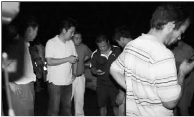
获释中国渔民立即拨打家人电话报平安

绑架事件发生后,中国驻喀麦隆大使馆迅速通报中喀两国政府,中喀双方高度重视,密切合作,积极开展营救行动。