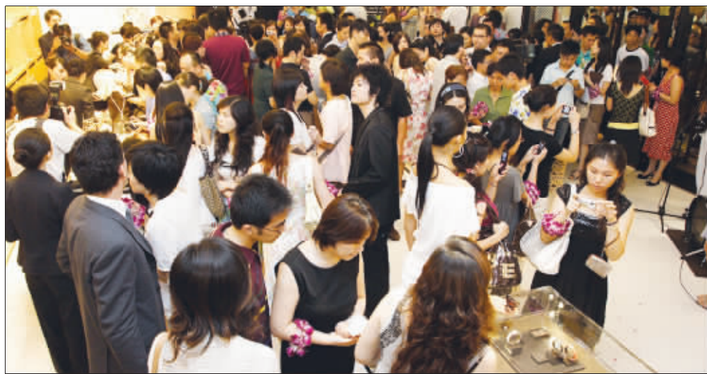
当年,路易·威登在德基广场的亮相激发了南京新一轮的消费热情

进入2010年,南京商业再度刮起一股“提档升级”的旋风,新百、南商、环北等各大商家争先恐后改造硬环境、提高品牌档次。记者在采访中发现,在宏观经济重“调结构”的背景下,南京的消费市场正迎来新一轮消费升级。被业内人士称之为“第三次消费高峰”的到来,也让百货业对“第二个春天”的期待由憧憬变得现实起来,被消费者“逼”出来的提档升级正在打开百货业春天的门。