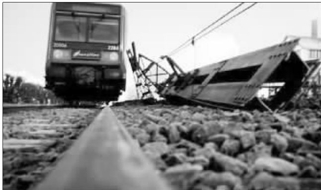
这张法国国营铁路公司2009年12月21日发布的照片显示的是法国巴黎东南舒瓦西勒鲁瓦的火车出轨事故现场 (资料图片)

据法国媒体称,该公司近日遭受了众多的投诉,乘客们指责法国铁路公司的客运列车晚点以及服务质量差等。综合