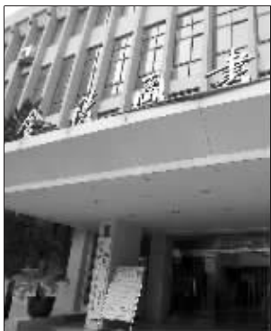
金图老馆成了抢手货