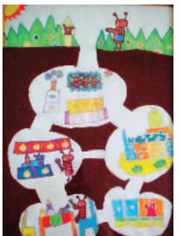
《蚂蚁的一家》马咏欣 石鼓路幼儿园 6岁