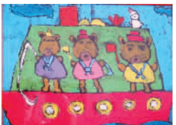
《小熊王国里的拿破仑》殷紫卉 石鼓路幼儿园 6岁