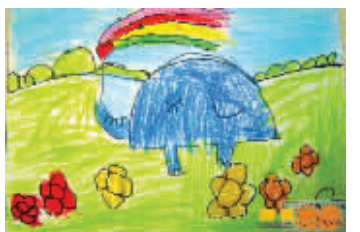
《大象》睿睿 点点周刊网友上传