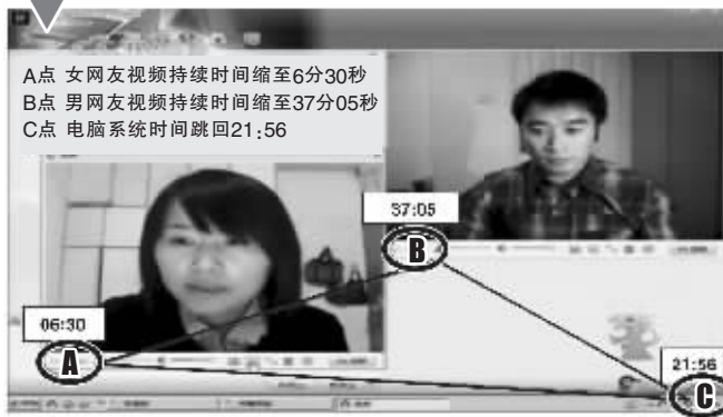
晚会大屏幕截图四