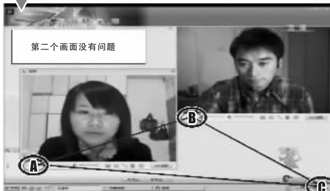
晚会大屏幕截图二