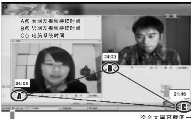
晚会大屏幕截图一