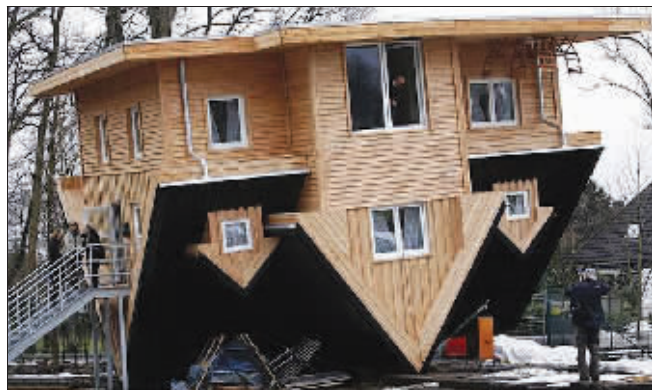
倒立的房子让人感觉很不稳