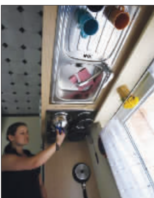
倒立的马桶和厨具

在德国杰托夫市动物园中，最近出现一栋倒立的房子。这栋房子的屋顶和阁楼都是钢筋所筑，里面的所有设施和家具都是吊在房顶上的，进入里面就像是进入一个完全颠倒的世界，令邻居和过路者十分好奇。这栋房子将于3月30日开门迎客。前来游玩的人需要做好充分心理准备，可能眩晕，提防坠物。