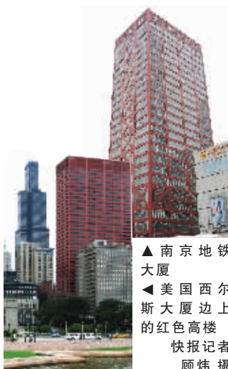
▲南京地铁大厦 ▲美国西尔斯大厦边上的红色高楼