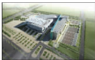
上图:南农体育中心设计图 下图:淮安体育中心设计图