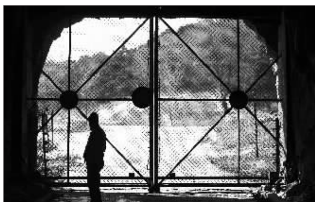
沈阳森林野生动物园东北虎放养区大门紧闭,野生动物园目前已经停业整顿,禁止任何无关人员进入