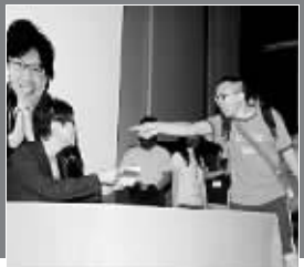
2009年7月 陈志云签名会上遭辱骂