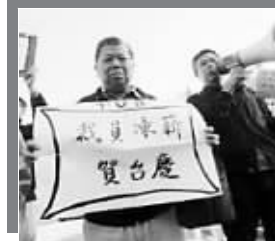
2008年12月 TVB裁员212人引发罢工