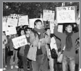
2010年1月 TVB幕后工作人员要求加薪