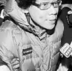
2010年3月 陈志云涉嫌贪污,接受调查