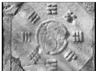
有一个外国人，居然从易经中“读”出了世界末日。图为刻有易经精髓的古老八卦石。