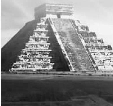
玛雅人的天文知识令人惊讶，他们甚至能预测未来几千年中的月食、日食。图为玛雅文化的遗址

但是，关于这次2012的预言，除了玛雅文明能够证明外，还有一个来自中国的古书进行了证明，那就是《易经》。