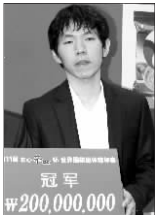
李昌镐重回世界围棋之巅