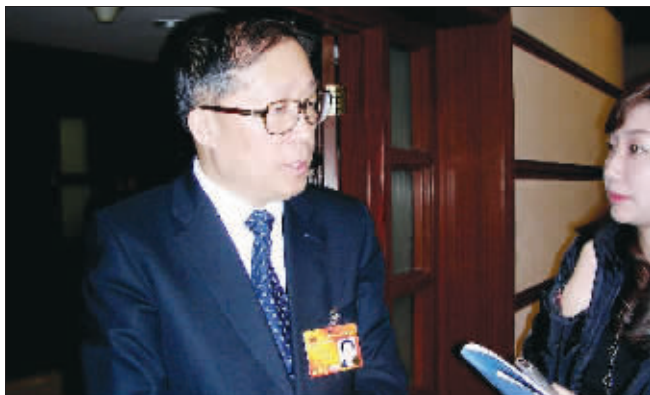
湖北省省长李鸿忠接受记者采访

李鸿忠：我请教她“您是哪个新闻单位的”，她说她是《人民日报》的。我就又问她：“你是《人民日报》的吗？”她就支支吾吾没再答了。后来我们得知她不是《人民日报》的，是《京华时报》的。不过《京华时报》也没关系，我觉得每个媒体都有采访、新闻监督的权利，这都很正常。我觉得理直气壮地说《京华时报》就好了，没什么问题。