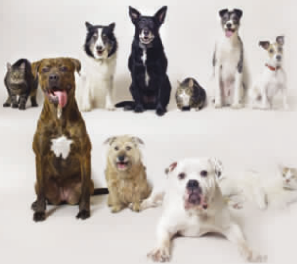
10位邮票明星全家福。前排(从左到右):小精灵、蒂亚、鲍里斯、纽扣。后排(从左到右):跳跳虎、塔夫卡、赫比、“土纳斯先生”、卡赛、莱昂纳德。

它们没有像一般的模特那样对着镜头微笑。但当它们聚集在一起时,它们的尾巴不停地摇摆,舌头懒洋洋地垂着,嘴里发出满足的声音。有些更是摆出了经典的姿态,脑袋歪在一边,郑重其事地盯着某处。