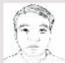
Pen News 潘文军 编译专栏