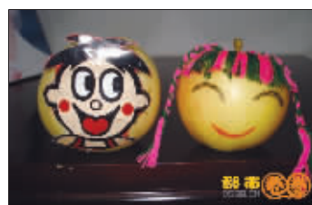
姓名:刘睿洋 编号:847号 生日:2007年3月2日

宝宝不管身在何处,只要有纸笔,她总能画些什么,上面的画是宝宝去北京游玩之后画的。