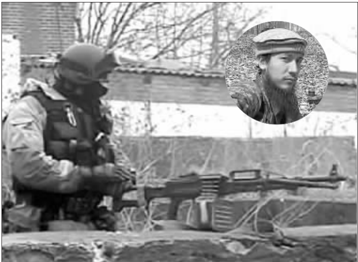
俄电视台公布的俄特种部队与恐怖分子的枪战镜头, 小图为季霍米罗夫

现年 28 岁的俄恐怖分子亚历山大·季霍米罗夫(原名赛义德·布里亚兹基)系俄头号通缉犯, 人称“俄罗斯的本·拉丹”。他曾策划于去年 6 月用汽车炸弹袭击俄印古什共和国总统叶夫库罗夫, 去年 11 月“涅瓦特快”号列车爆炸案等重大恐怖活动。据俄反政府非法团伙和俄联