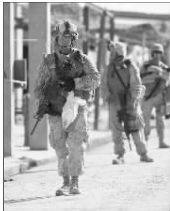
2010 年 3 月 7 日, 一名美国海军陆战队士兵手里抓着一只鸡(是的, 你没看错)在阿富汗南部赫尔曼德省 Now Zad 地区巡逻, 这只鸡是全副武装的美军士兵在巡逻过程中从市场上买来的。 综合