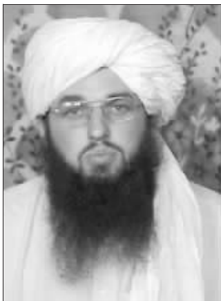
3月7日, 亚当·贾丹还在录像中号召袭击美国

巴基斯坦官员3月7日宣布, 美国籍基地组织发言人亚当·贾丹在巴基斯坦第一大城市卡拉奇被巴安全部队逮捕。贾丹在今年1月被美国《新闻周刊》杂志列为“美国政府最想抓住的7名恐怖分子”之一, 他也是美国二战之后半个多世纪以来遭叛国罪起诉的第一人。分析人士指出, 如果贾丹落网的消息属实, 将是美国反恐行动取得的一项重大胜利。不过, 巴基斯坦安全部门3月8日又否认贾丹落网。