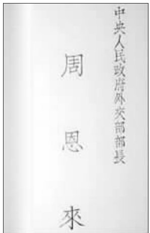
周恩来任外交部部长时使用的名片