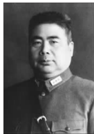
拥有这张毛泽东名片的冯玉祥