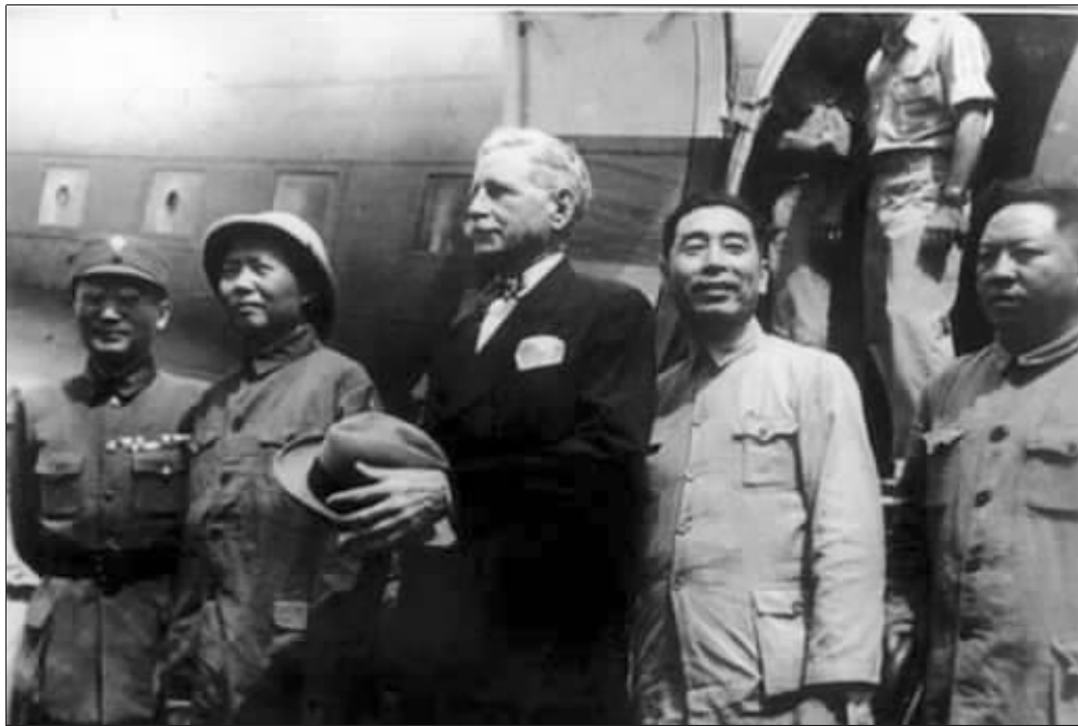
1945年8月,毛泽东(左二)、周恩来(左四)、王若飞(左五)在延安机场,准备前往重庆参加谈判 资料图片

位于中山东路上的中国第二历史档案馆内珍藏着一些名片,它们的主人毛泽东、周恩来、王若飞等。这些名片都只有极少数人见过,它们被深藏在档案馆的特藏库中,相当珍贵。小小名片,为何值得如此珍藏?名片的背后隐藏了什么样的往事?如果非要算个价格出来,这些名片价值几何呢?