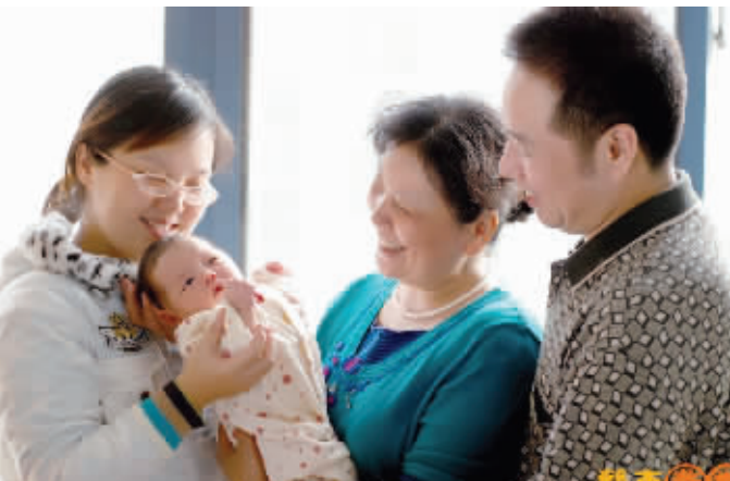
831号周顾全宝宝的全家福

婆媳关系恐怕是家庭关系中最难处理的一项了，再聪明的小主妇，面对婆婆时，也不得不小心翼翼地打起十二分精神。婆媳过招，最高境界就是以不变应万变，以静制动。下面奉上搞好婆媳关系的八个原则：