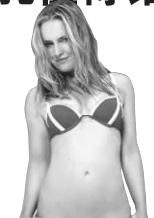
沃恩是冬奥会第一美女

将沃恩就是女子高山滑雪速降项目的最大夺标热门,然而就在比赛开始前,她被伤病击倒,没能参赛。这次,25岁的沃恩带着腿伤如愿以偿。除了克服腿伤带来的干扰,她还征服了一条充满凶险的赛道。