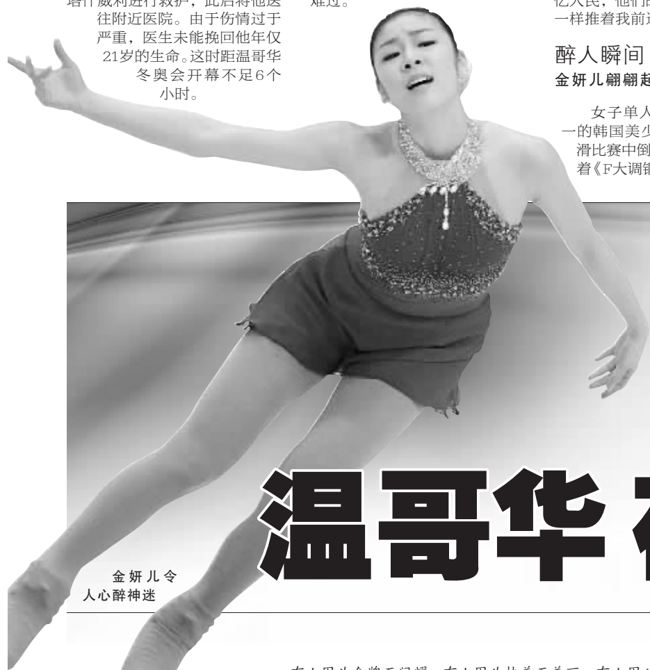
金妍儿令 人心醉神迷

——荷兰四人雪车队的舵手卡克由于对参赛缺乏信心而宣布退赛。他的这个决定招来了众说纷纭。