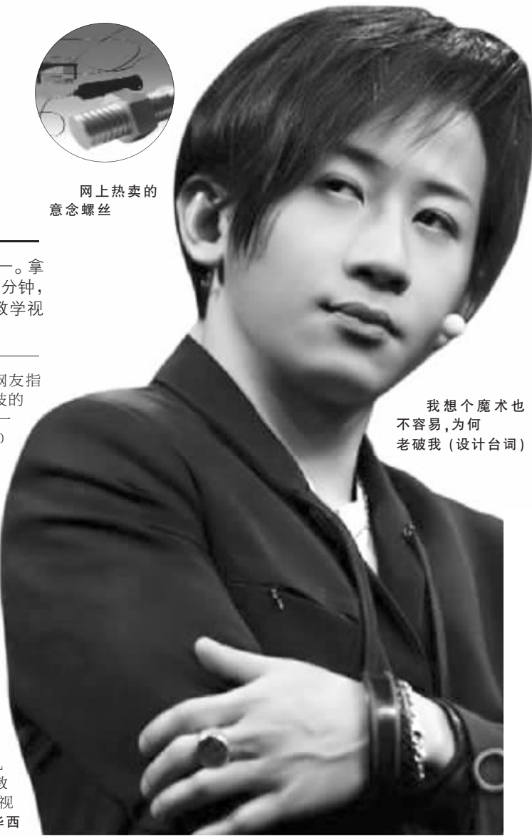
我想个魔术也不容易,为何老破我(设计台词)