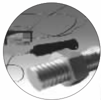
网上热卖的意念螺丝

现场,刘谦找三位观众要了三枚戒指,最后一位观众是著名导演陈维亚,刘谦当众把三个戒指变成“连环套”,随后又逐个解套。有网友发帖:“戒指魔术,我就不多说了,老外几年前就不玩这个了,我有好几套道具,大家可以看看完全教学。”该网友还附上了教学视频,引来疯狂点击。 华西