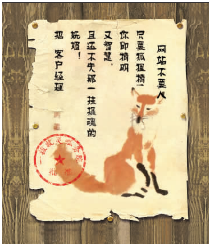
芜湖某单位官方网站的雷人招聘启事

“我们网站不要人,要人只要色情狂;我们网站不要人,要人只要神经病;我们网站不要人,要人只要狐狸精……”这是什么单位?怎么只要色情狂、神经病、狐狸精这些“妖孽”?很严肃地告诉你,这是一家正规单位,安徽芜湖某媒体下属官方网站,其官方网站在招聘时就打出如此旗号,招聘色情狂、神经病以及狐狸精等。而该网站的负责人对此解释称:“我们招聘的不是人,是妖!”