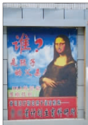
网络热传的雷人DNA广告

谁是孩子的父亲和蒙娜丽莎有什么关系呢?可是,就有牛人将两件不相干的事物联系到一起。日前,一张某省计划生育研究科的DNA鉴定广告的图片,愣是将蒙娜丽莎和谁是孩子的父亲扯到一起。难道找不到父亲的孩子都是蒙娜丽莎的?