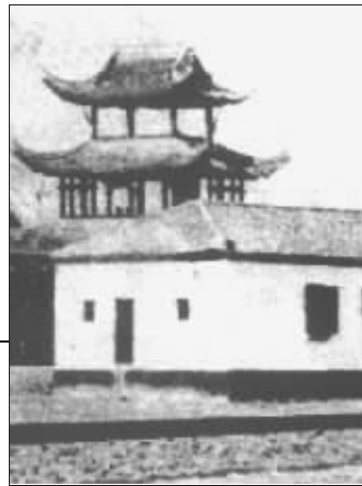
“署东高楼”位于总督署东墙内侧,今已不存。这张照片摄于清末民初,督署东墙外有“小铁路”及“小铁路”督署站。当年,孙中山就是在此处下车,前往总统府就职的。