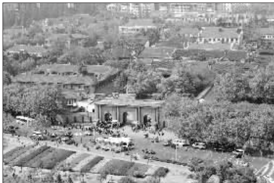
鸟瞰长江路上昔日的两江总督署,如今车水马龙,热闹非凡。因为它历史的韵味,全国各地、四面八方的游客云集于此,感受着总督署浓浓的岁月风情。