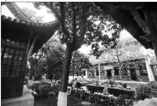
位于西花园内的观戏台。当年,天王洪秀全曾将此处送给妹妹洪宣娇。洪宣娇在这里调教乐工,排练曲目,逢着节日,王府内常常好戏连台。