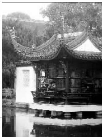
西花园内的忘飞阁,得名于鸟儿飞临此处乐景忘飞。此处三面临水,当年洪秀全曾在此处辟“天王消暑处”。