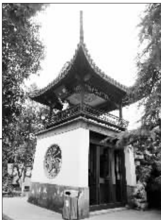
位于西花园西南角的望亭,太平天国时期,曾被派作报更和瞭望军情的用途。亭上匾额“御风”二字,出自国民党元老居正之手。