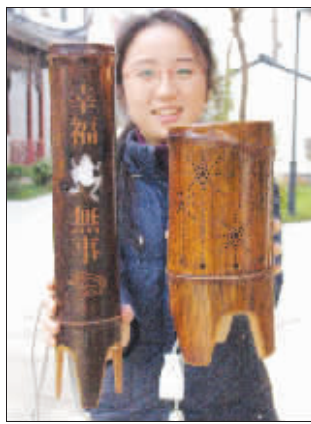
竹子外壳的花灯由日本艺人全手工雕刻而成

在这些花灯中，最引人注目的无疑是占地100平米、20米长的主灯“国泰民安一虎年大吉”，这也是胥门灯会有史以来占地面积最大的灯组。在前天的装配现场，散落的龙头、灯柱铺了一地。据制作人员介绍，这尊主灯由2只老虎和6条龙组成，龙代表中华民族，老虎则是虎年的象征。其中四条龙分居主灯四角，两条龙置于南北两侧，中间是两只拱手拜年的卡通老虎。该灯高度可达4.5米，上端的花灯完全仿照清代的宫灯制作。共有6个龙头。为尽可能还原清代宫灯原形，10多位工匠花费了近1个月时间制作而成，整座灯组分为贴布、烧架、放样等10多道工序。该灯