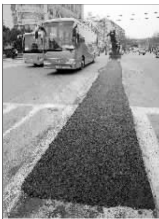
昨天,蒋王庙路段正在进行修补。

市建委、市政公用局联合调查组初步调查表明,该工程建设程序符合要求,主体质量总体受控。