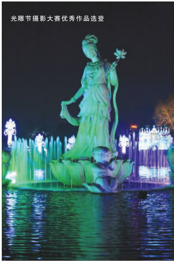
光雕节摄影大赛优秀作品选登