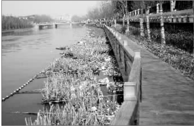
方大七把这一排景观灯都给砸了