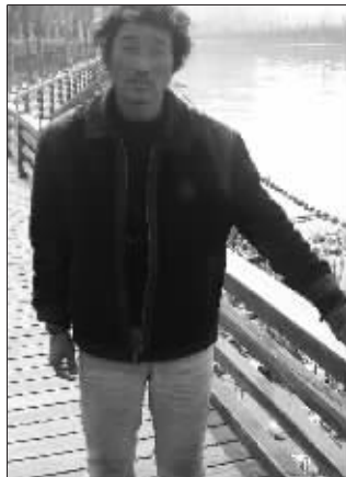
方大七在指认现场