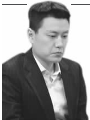
孔杰比赛时神情严峻