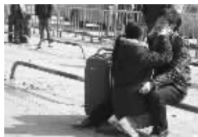
有人临时充面人任你捏弄