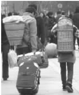
有人伴你分担重负