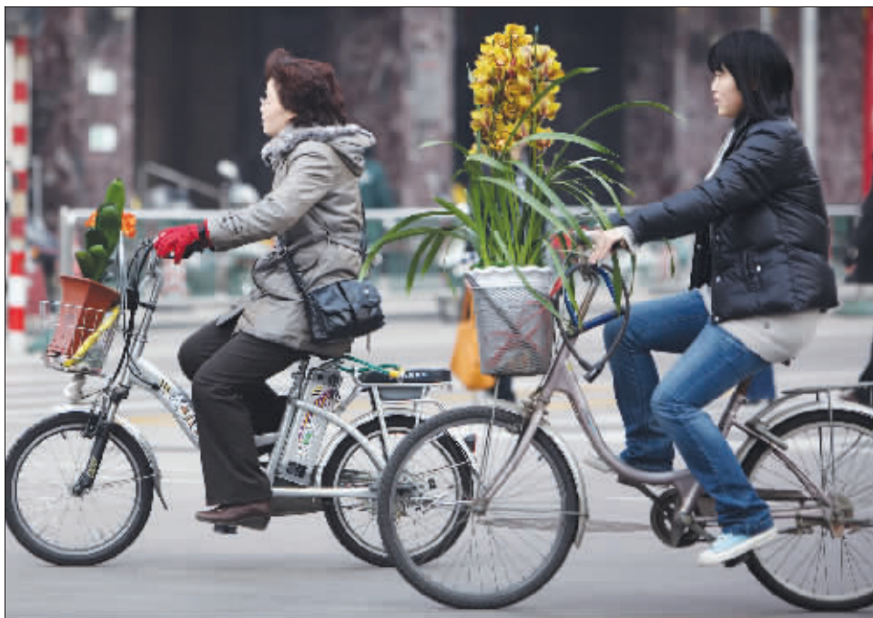
昨天,两位市民骑着自行车,将“春天”运回家