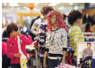
春装卖得火

快报讯(记者 陈英)这几天,阳光灿烂,天气晴好,气温也噌噌蹿升,厚厚的冬装都穿不住了,商场里的春装开始热卖。昨天记者在新街口的商场转了一圈,发现大部分柜台都以春装为主了,冬装被“挤”到了断码打折区。