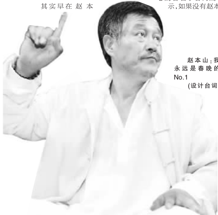
赵本山:我永远是春晚的No.1 (设计台词)

山《卖拐》系列小品走红时,学者吴祚来就对赵本山的“霸权现象”提出了批评,而今年他的抨击更加强烈,“以赵本山为核心的文化集团在娱乐圈已是一座不可小觑的山头,这座山之高,直接链接着央视春晚巅峰时刻,他们之间俨然已是利益共同体,央视可以通过赵本山小品获取收视率和广告收益,而赵本山也可通过春晚来推出他的新弟子……”清华大学艺术教育中心的著名学者肖鹰也表示,如果没有赵本山,