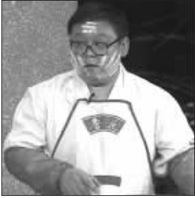
各类广告在春晚中层出不穷

不同,除了国窖酒是央视方面的安排,搜狐和三亚都是老赵自己的项目。知情人透露,搜狐此次植入广告打包价,只有400万元。国窖酒对这个植入广告投入的成本则是500万。传闻这部分广告收入央视和本山是五五分成的。