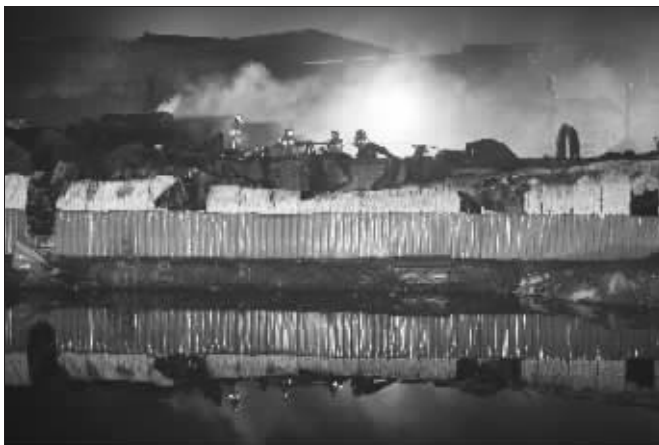
2月21日,发生火灾的废品回收站内一片狼藉

据了解,消防人员从废墟中挖出了6具死亡人员的尸体。此外还有8名工人不同程度受伤,已分别被送往武警上海总队医院和瑞金医院救治。记者致电瑞金医院了解到,一名工作人员表示,18时许,两名火灾中的伤者被送到瑞金医院救治,目前两名伤者均有生命危险,已经通知家属前往医院办理相关手续,伤者为一男性和一名女性,一个烧伤面积达68%,一个烧伤面积达11%。记者随后从武警上海总队医院了解到,另外6名伤者被送往该院烧伤科救治,据工作人员介绍,伤者多为四肢面部不同